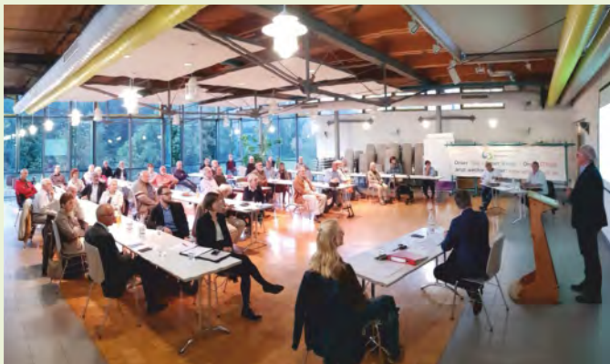
Knapp 50 Mitglieder und Gäste besuchten die Generalversammlung am 22. September in der Seniorenbegegnungsstätte in Unterweissach

„Unsere Motivation ist der Klima- und Umweltschutz für eine lebenswerte Zukunft für uns und künftige Generationen.“