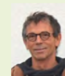
Bernhard Bocek E-Mobilität Ladesäulen