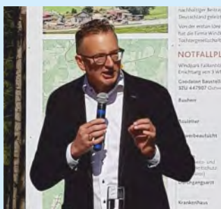
Andreas Schwarz MdL Fraktionsvorsitzender der Grünen im Landtag von Baden-Württemberg